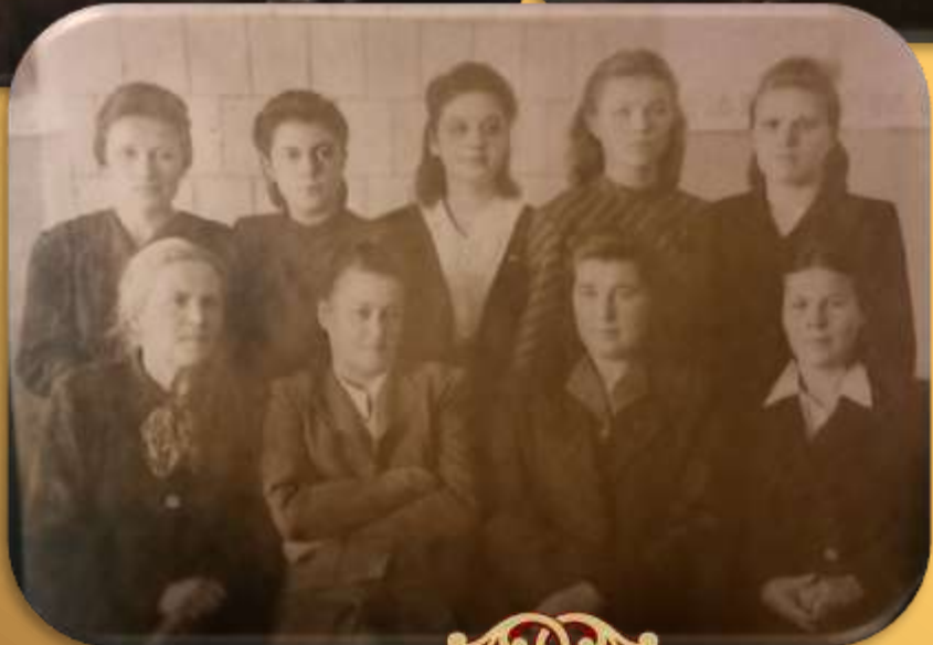
Коллектив Углубленного Детского Дома №90