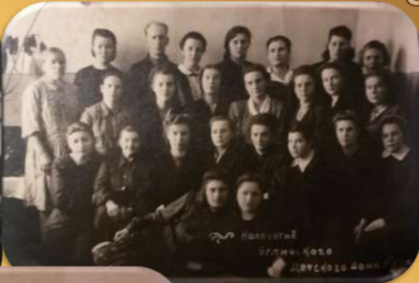
Коллектив Углубленного Детского Дома №90