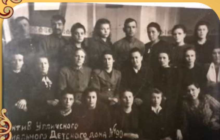
Коллектив Уличского Углубленного Детского Дома №90