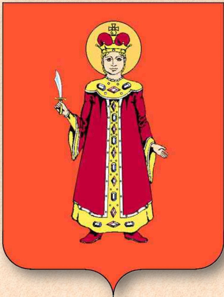
Официальный герб города Углича

Углич - один из старейших городов Ярославской области, расположенный на реке Волга. Углич - старинный город, ему больше 10 веков. Он был основан около 937 года. Сейчас население города составляет 37 тыс. человек.