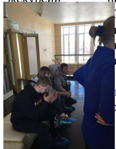
рассказ о мировой

Во время школьных каникул мы посетили очень интересный музей гидроэнергетики. Наша экскурсия началась с просмотра мультфильма о создании платин и просмотра виртуальной экскурсии по