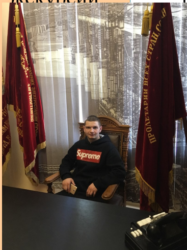
рассказ о мировой

Во время школьных каникул мы посетили очень интересный музей гидроэнергетики. Наша экскурсия началась с просмотра мультфильма о создании платин и просмотра виртуальной экскурсии